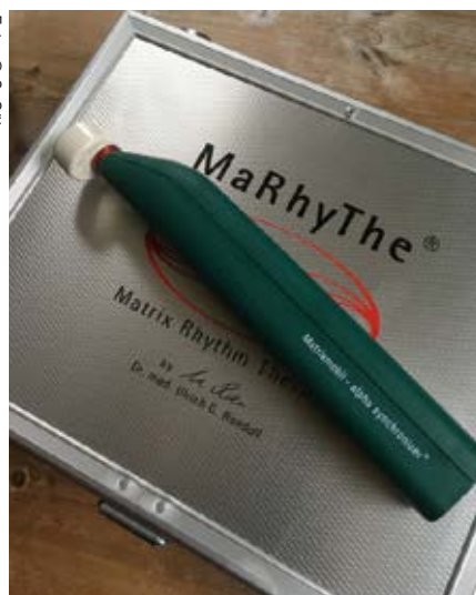
Das kabellose Matrixmobil alpha synchronizer® VETERINÄR