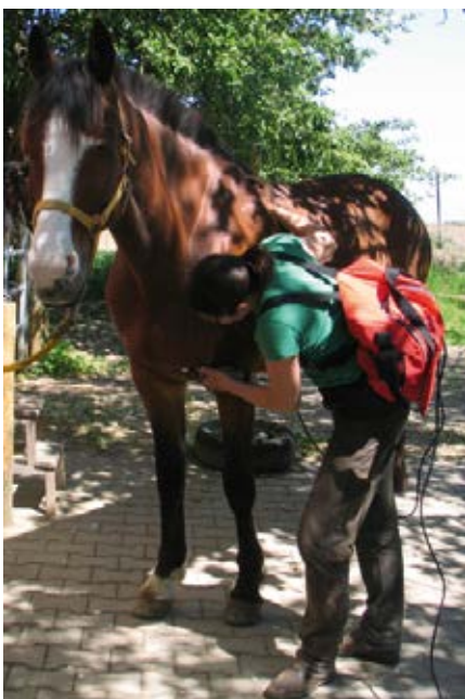
Ich fand es am bequemsten, das Gerät mit Kabel beim Behandeln auf dem Rücken zu tragen – in einem gepolsterten Thermorucksack.

Claudia Götz Pferdekosmos.de Pferdegoetz.de