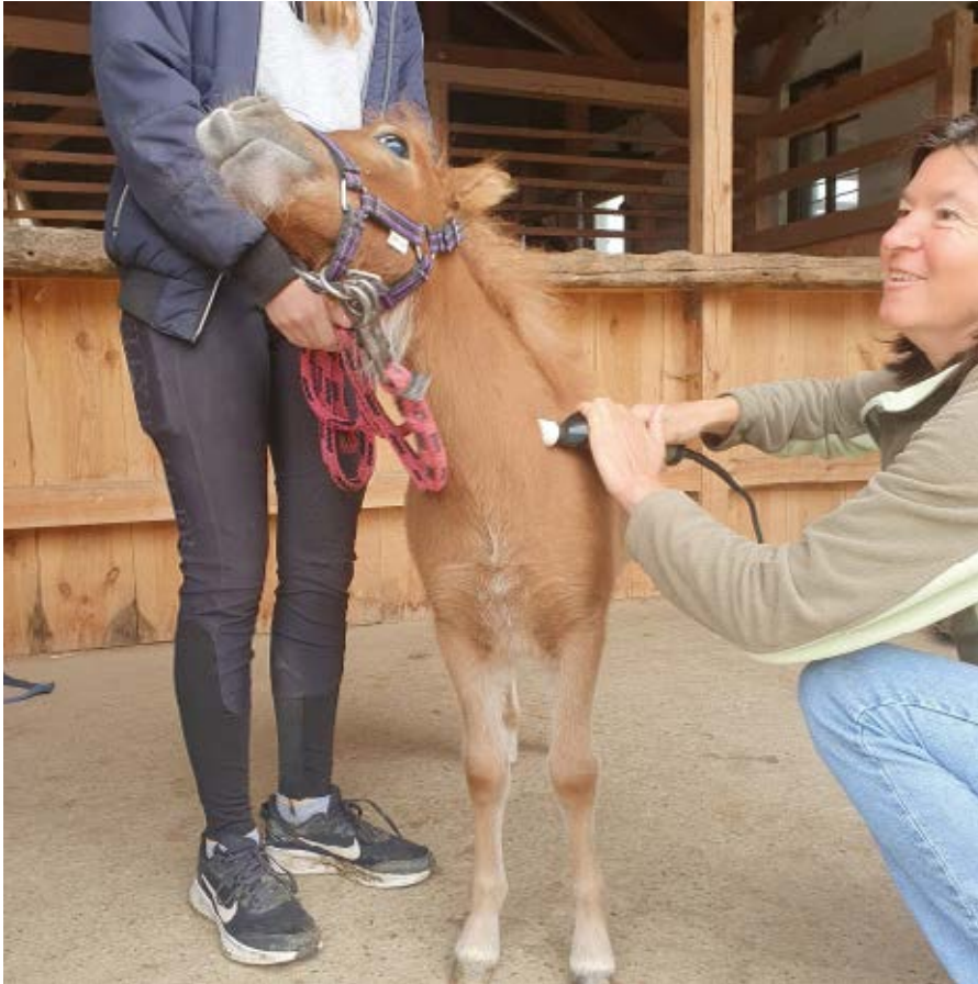
Auch wenn Fohlen bei der Geburt bereits osteopathische Probleme erwerben können, darf es manchmal auch einfach nur Wellness sein.