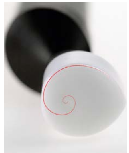
Der Resonator ist der als logarithmische Spirale schwingende Kopf jedes Matrixmobils.