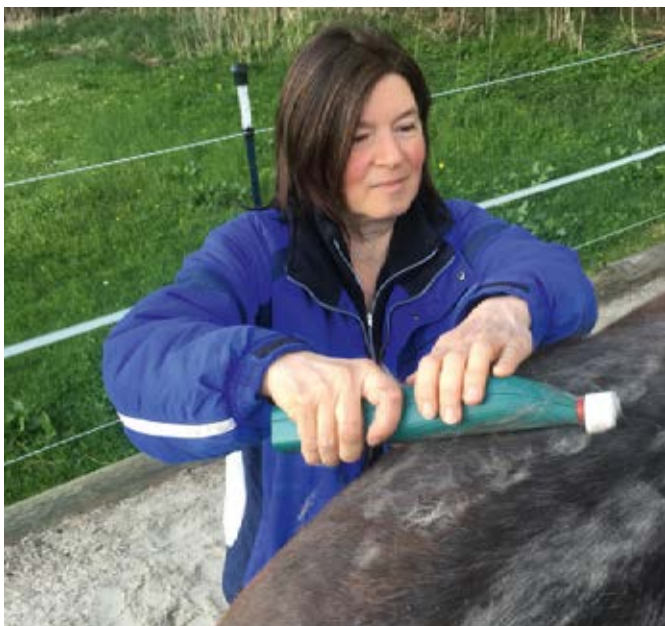
Eine Hand führt, die andere kann nach Bedarf zusätzlich Druck geben, ...