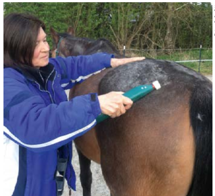
... das Gewebe für mehr Extension leicht halten oder erspüren.