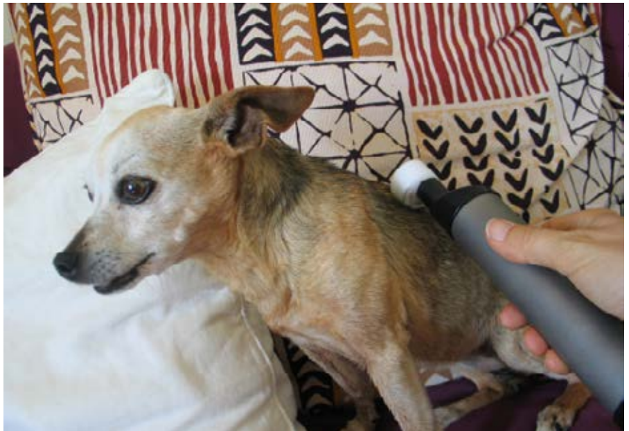
Egal welches Matrixmobil® – auch sehr kleine Tiere lassen sich gerne und effektiv behandeln.

Behandlung nach Gangstörung/ Lahmheit unbekannter Ursache: Vielfach werde ich zu Pferden gerufen, die aus unbekannter Ursache lahmen oder lahm waren. Auch hier ist es mir wichtig, bei einer Behandlung des gesamten Körpers alle Verspannungen zu lösen – die ursprünglich ursächlichen und die kompensatorischen. Auch wenn die Bewegungsanalyse vorab natürlich ebenfalls Verspannungen und Blockierungen zu erkennen gibt, finde ich über die Rückkopplung des Gerätes oft interessante Hinweise auf mögliche Ursachen. Und oft erfährt man aus dem